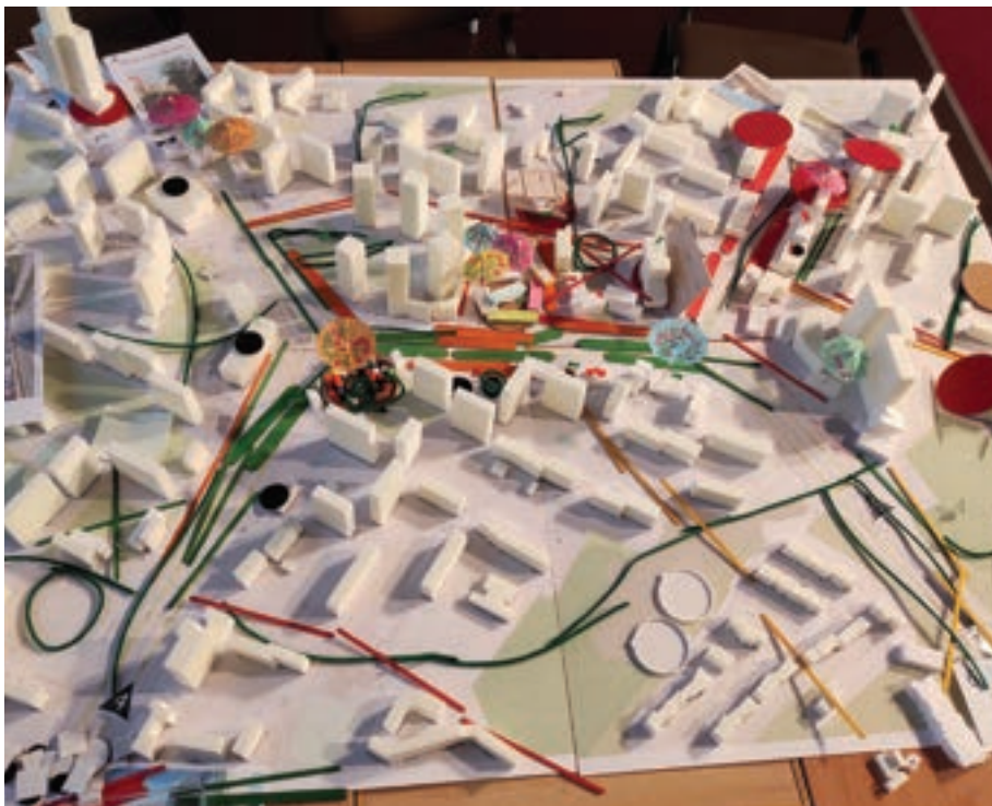
Makieta terenu Piecек-Migowa po procesie konsultacji.

Uczestnicy zostali podzieleni na grupy i pracowali kolejno nad kolejnymi obszarami problemowymi takimi jak przyroda, rekreacja i ekologia, zrównoważona mobilność, zarządzanie przestrzenią i aktywności społeczne. Najwięcej uwagi uczestnicy poświęcili zarządzaniu przestrzenią. Ten też temat budził najgorętsze dyskusje. Jeden z efektów tych prac widzicie Państwo na umieszczonych w artykule zdję-